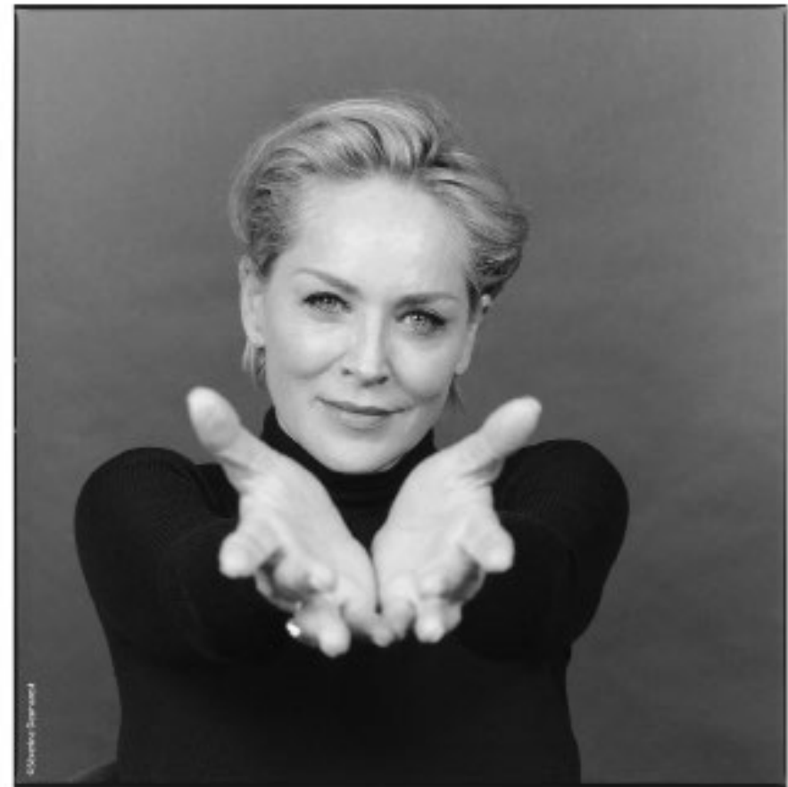
Sharon Stone (USA) "Prix de la Paix" 2013 pour son engagement en faveur de la lutte contre le SIDA.

Depuis les débuts du projet, l'UNESCO soutient les Mains de la Paix qui porte pleinement l'esprit de ses actions d'éducation à la paix.