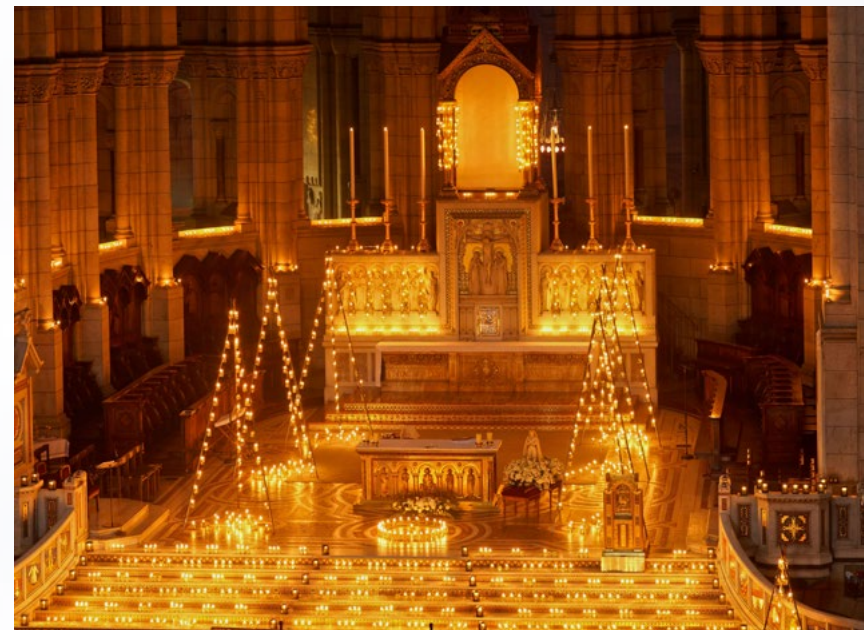
Illumination du Sacré Coeur de Montmartre