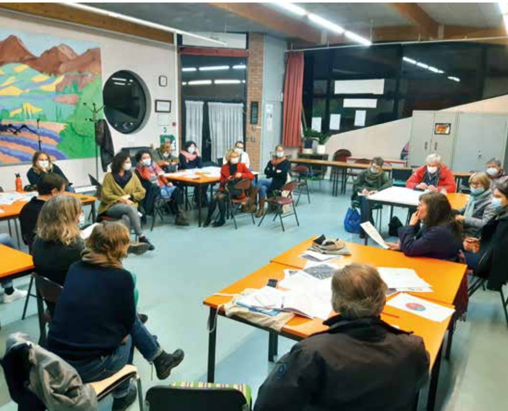
ASSOCIATION DES DEUX FAUBOURGS

Le conseil d'école constitué de parents élus se rencontre trois fois par an. À ce jour, ils ont obtenu : la fermeture de la rue d'Arsonval aux véhicules, la révision des fenêtres, des sanitaires refaits, un râtelier pour les vélos et un système d'alarme fonctionnel. L'Association Moulin Pergaud Florian (AMPF) organise des actions de collecte de fonds (marché de Noël, bourse aux livres...) pour financer une partie des sorties scolaires. Le fruit d'une vente de jacinthes a ainsi permis aux élèves de CM2 de bénéficier d'une journée Laser Game et cinéma (avec transport gratuit), pour la plus grande joie des enfants. Une tombola a permis aux enfants de recevoir un sac en tissu au logo de l'association, un livre et des friandises. D'autres projets sont à l'étude, peut-être cette année un marché de Noël avec vente d'objets décoratifs créés par les parents. Toutes les bonnes volontés sont les bienvenues.