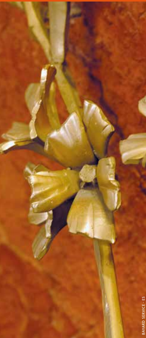
BAYARD SERVICE - ES