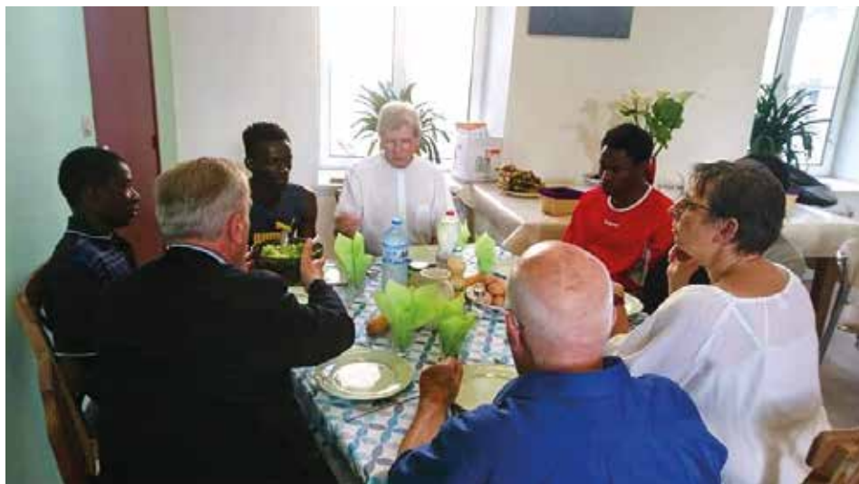
Avec les visiteurs d'un soir.