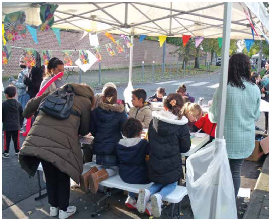
– La rue aux enfants.

L'Association est ouverte à toute initiative et vous pouvez rencontrer plusieurs membres au local associatif (1 rue Berthelot), le 3e jeudi de chaque mois, à 19h. Son site : ad2f.fr/ Sur Facebook : Associationdes2faubourgs/