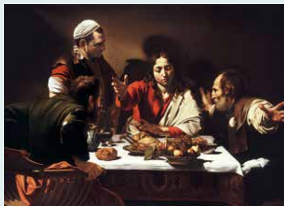
Œuvre du Caravage : Le Souper à Emmaüs (1601-1602).