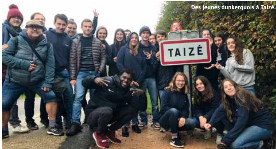
Des jeunes dunkerquois à Taizé.

jour avec les frères), du service (à la vie du groupe via la vaisselle ou la distribution des crêpes) et de la rencontre avec des jeunes venant de tout horizon.