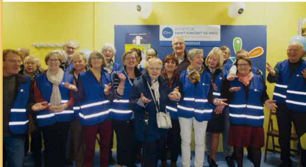
Quelques-uns des 73 bénévoles qui portent l'association.