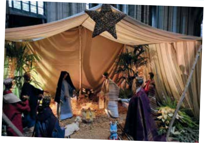
Crèche de l'église Saint-Éloi à Dunkerque.