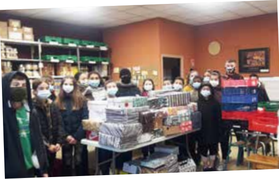
Jeunes du groupe scolaire du Sacré-Cœur (Saint-Pol-sur-Mer) : remise des « boîtes-cadeaux » pour les bénéficiaires de Saint-Vincent-de-Paul.