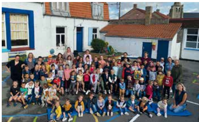
Remerciements à l'APEL pour les travaux de la cour de l'été.

J'apprécie aussi les relations avec les différentes associations, la mairie, tous les partenaires du village. Il y a eu un échange intergénérationnel avec l'association des anciens combattants qui ont organisé un concours. Les deux élèves gagnants ont lu le texte à l'occasion du 11 novembre. Il y a aussi le conseil municipal des jeunes : des petits jeunes CM1 et CM2 sont devenus conseillers municipaux. Au début de l'année les enfants font des