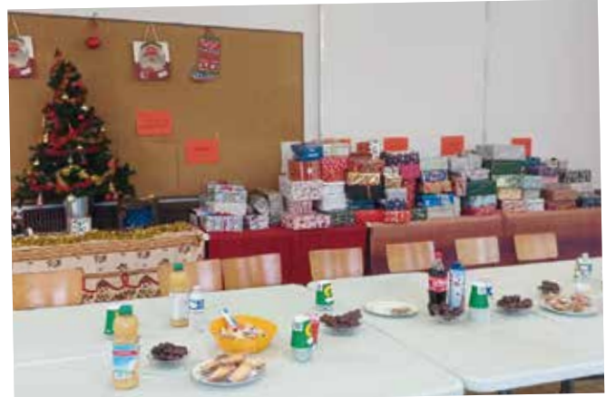
Noël solidaire Saint-Vincent-de-Paul : boîtes-cadeaux réalisées par les paroissiens, les enfants de la catéchèse, les jeunes de l'AEP, les communautés éducatives des écoles du Sacré-Cœur et de la Providence, du collège du Sacré-Cœur de Saint-Pol Petite-Synthe.