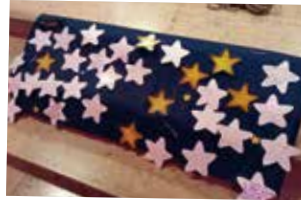
Noël en Mission ouvrière.