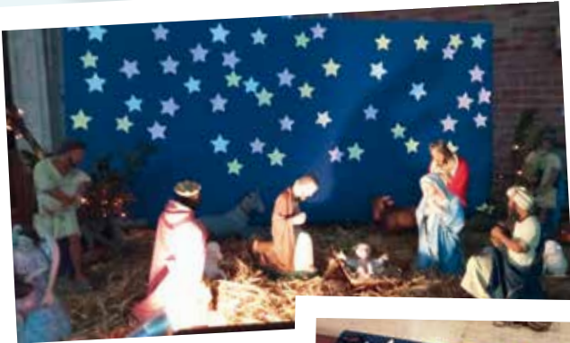
Crèche de l'église Saint-Benoît – Saint-Pol Petite-Synthe.