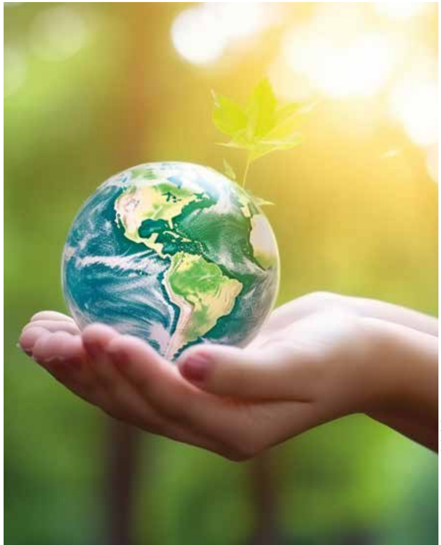
ADOBE STOCK - IMAGE GÉNÉRÉE À L'AIDE DE L'IA

« Ô Dieu des pauvres, aide-nous à secourir les abandonnés et les oubliés de cette terre. Guéris nos vies pour que nous soyons des protecteurs du monde et non des prédateurs, pour que nous servions la beauté et non la pollution ni la destruction. »