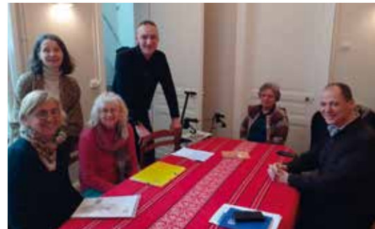
L'équipe du Sem.

Pour aller plus loin : l'équipe accueille volontiers de nouveaux membres et se rend disponible pour les personnes qui auraient besoin de ces visites fraternelles. Contacter la paroisse : Site internet : paroissetrinite-lambersart.fr Courriel : paroissedelambersart@gmail.com Tél. 03 20 92 30 97