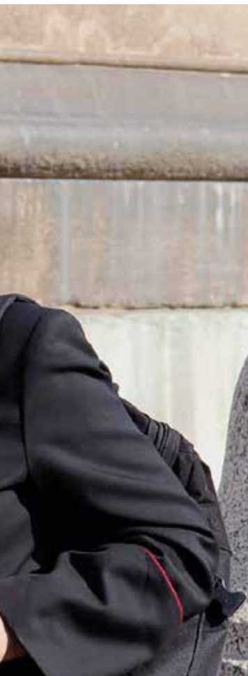
Diocèse de Coutances

«J'apprendrai de vous. Vous me ferez partager vos peines et vos joies. Je contemplerai votre foi, votre charité et votre espérance.»