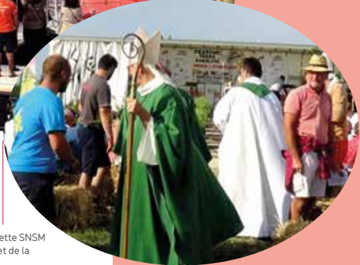
Diocèse de Coutances

Lors d'une bénédiction d'une vedette SNSM et pendant le Festival de la terre et de la ruralité (septembre 2022).