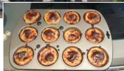
Les pastéis de nata.

Une équipe de jeunes vous prépare un voyage culinaire et vous fera découvrir les traditions portugaises. Notez déjà la date du dimanche 5 février 2023, jour du repas paroissial au profit des JMJ, au lycée Camille de Lellis! Ce sera l'occasion de vous faire découvrir la gastronomie locale tout en profitant d'ateliers sur les traditions portugaises.