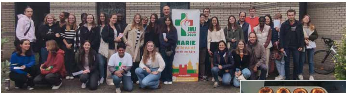
Le groupe des JMJ des Rives de la Deûle, le 16 octobre.

Les inscriptions aux Journées mondiales de la jeunesse approchent. Le groupe des Rives de la Deûle «Banco» est en train de se former. Grâce aux rencontres de préparation, les jeunes commencent à se connaître et mettent en place des actions pour permettre à chacun de vivre cette aventure.