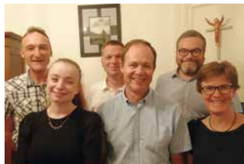
L'équipe d'animation paroissiale.

C. Comme responsable Jeunesse et Communication, ce sont nos réunions JMJ et leurs moments de partage entre jeunes, chrétiens ou non, avec pour tous la volonté de se connaître et de tisser du lien.