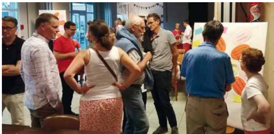
Présentation du projet paroissial aux paroissiens.

L'Église de Lambersart est déjà très riche de propositions pour accompagner les