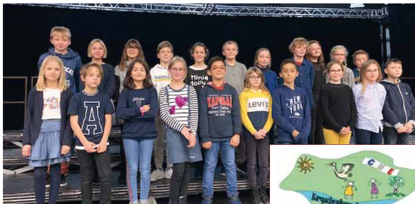
Une partie de la nouvelle équipe tout fraîchement élue.

En cette période électorale, tout le monde sait ce qu'est un conseil municipal, mais connaissez-vous le conseil municipal des enfants ?