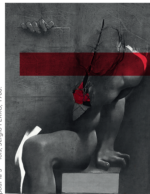
Les Pas de la Passion, Jésus tombe pour la 3 ème fois, Sergio FERRO, 1986.

La foi chrétienne prend davantage racine dans la Résurrection que dans la Passion du Christ, dont la souffrance est avant tout un chemin vers la Vie éternelle promise à tous les Hommes. Cette universalité de la souffrance, mais avant tout de l'Espérance, se retrouve dans les œuvres de la « Collection Delaine ».