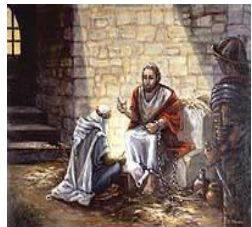
"Paul in Prison," by Karen Anne Graeser

Du fond de sa prison romaine, Paul, âgé, adresse ce dernier message à Timothée. Il montre ce qui est à la base de toute intelligence. C'est de « se souvenir de Jésus Christ » qui concentre toutes les pensées, toute la sagesse de Dieu . Les deux caractères de Christ : il est ressuscité d'entre les morts et il appartient à la lignée de David.