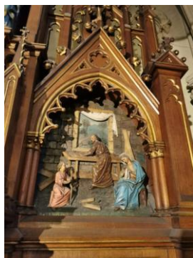
Chapelle St Joseph Eglise St André

Saint Joseph, Maître de la vie intérieure, Apprenez-nous à vivre au quotidien Dans l'intimité de Jésus et de Marie Et dans l'abandon confiant à l'amour de Dieu le Père. Saint Joseph, protecteur de la famille de Nazareth, Nous vous confions l'avenir de nos familles. Qu'elles soient des foyers d'accueil et d'amour. Aidez-nous dans l'éducation chrétienne de nos enfants. Saint Joseph, modèle des travailleurs, Nous vous confions notre travail quotidien, Qu'il contribue au bien-être de tout homme. Amen.