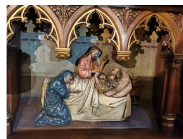
Chapelle St Joseph Eglise St André

Saint Joseph, Maître de la vie intérieure, Apprenez-nous à vivre au quotidien Dans l'intimité de Jésus et de Marie Et dans l'abandon confiant à l'amour de Dieu le Père. Saint Joseph, protecteur de la famille de Nazareth, Nous vous confions l'avenir de nos familles. Qu'elles soient des foyers d'accueil et d'amour. Aidez-nous dans l'éducation chrétienne de nos enfants. Saint Joseph, modèle des travailleurs, Nous vous confions notre travail quotidien, Qu'il contribue au bien-être de tout homme. Amen.