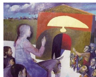
"Entrée à Jérusalem" - Arcabas vers 1980 http://artbiblique.hautetfort.com/