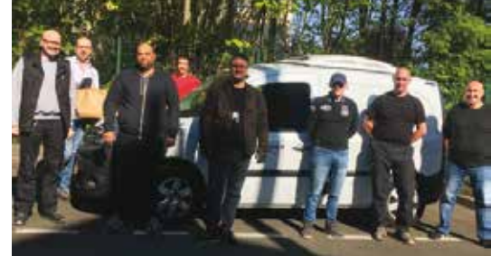
L'équipe d'intervention du CCAS.

Nous avons réalisé tout cela en télétravail, car les locaux du centre étaient fermés. Nous avons l'expérience du réseau constitué pour vaincre l'isolement des