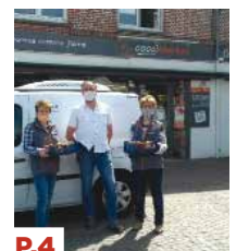
P.4 DOSSIER Le CCAS de Saint-André se mobilise