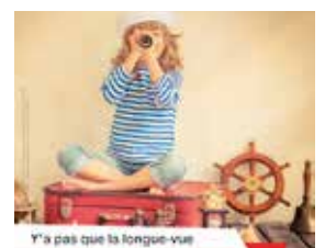
P. 7 Y'a pas que la longue-vue pour voir loin dans la vie!

PAROISSE Inscriptions au caté et à l'aumônerie