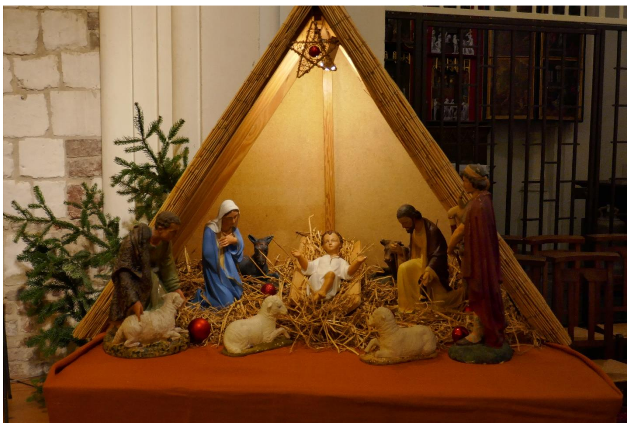
Crèche de St Lambert à Wattignies

Que cette fête de la Nativité, que Jésus venu rejoindre notre humanité vienne faire grandir notre espérance dans l'attente de jours meilleurs.