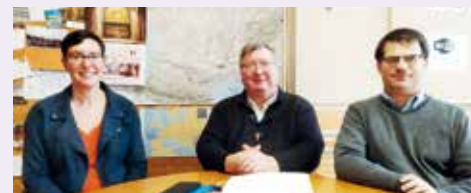
L'ÉQUIPE DES PÈLERINAGES À VOTRE SERVICE.

Pour des impératifs de législation et de fiscalité, si vous organisez pendant l'année un déplacement ou un pèlerinage pour votre paroisse ou votre doyenné, vous devez vous rapprocher du service des pèlerinages.