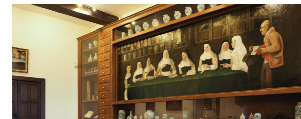
Sœurs augustines à la Pharmacie de l'Hôpital Notre-Dame (Musée Hospice comtesse)

A l'hôpital Notre-Dame, aujourd'hui Hospice Comtesse, des soignants et soignantes laïques se constituèrent en communautés religieuses. Ces communautés embrassèrent la Règle de Saint-Augustin imposée par le Concile de Latran en 1215.