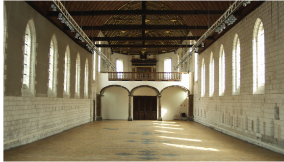
La Salle des malades de l'Hospice comtesse (Musée Hospice comtesse)

Les soins y étaient donnés dans la recherche du salut. La Salle des malades est prolongée par la Chapelle qui a conservé le tableau du maître autel qui représente la Présentation de la Vierge au Temple d'Arnould DE GUEL daté de 1699.