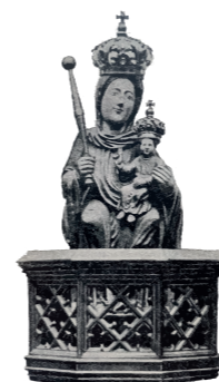
Antique Statue miraculeuse de Notre-Dame de la Treille du XIII ème siècle

Cette statue du XIII e exécutée en bois et en pierre appartient au groupe des « Vierges à l'Enfant » appelées « Vierges de majesté » ou « Sedes sapientiae » (Siège de la Sagesse) : la Vierge Marie est représentée assise sur un trône, portant l'enfant sur un de ses genoux. Rapidement elle est dotée d'une petite grille en fer forgé, «une treille » qui lui donne son nom.