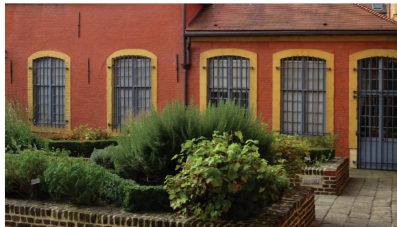
Le jardin médicinal (Musée Hospice comtesse)

Le jardin médicinal très précieux fournissait une quantité de remèdes. Les plantes cultivées : Sarriette des montagnes, Fenouil, Balsamite, Rue fétide, Vigne, Muguet, Romarin, Lavande, Achillée millefeuille, Thym, Acanthe molle, Fraxinelle/ buisson ardent, Origan, Chicorée, Pivoine officielle, Lin, Iris de Florence, Bétoine, Menthe, Sauge officinale, Aurone, Sauge sclarée, Aigremoine et Grande Consoude.