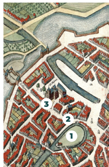
Plan de Lille de 1649 (détail d'après BLAUE, Archives municipales de Lille)