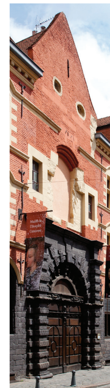
Musée Hospice Comtesse (Vue façade extérieure, Musée Hospice comtesse)

L'ancien hôpital Notre-Dame est fondé en 1237 par Jeanne, Comtesse de Flandre, dans le cœur de Lille, près de l'ancien rivage de la Basse Deûle. Deux incendies l'ont ravagé en 1468 et 1649. Les Sœurs Augustines y apportaient soins et réconfort aux malades pauvres et pèlerins. Il y avait 120 lits en 1745. Par la suite, ce fut un Hospice pour vieillards. Actuellement, c'est un Musée.