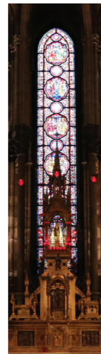
Chapelle Notre-Dame de la Treille