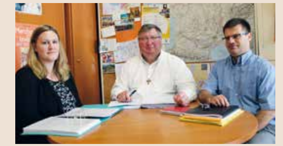
L'ÉQUIPE DES PÈLERINAGES À VOTRE SERVICE.

Si vous organisez pendant l'année un déplacement ou un pèlerinage pour votre paroisse ou doyenné : pour des impératifs de législation et de fiscalité, nous vous conseillons de vous rapprocher du service des pèlerinages diocésain.